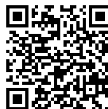
TABLA INTERNACIONAL DE TALLAS

Si se encuentra entre dos tallas, le recomendamos que elija la talla más grande. THOMAS SABO no se hace responsable de los errores derivados de la utilización de esta guía de tallas.